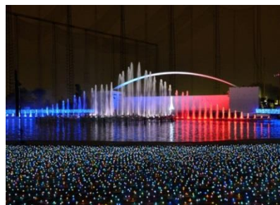
よみうりランドのイルミネーション。フランスの演出家による光、噴水、音楽そしてダンスのショー(パリ・ラ・メルヴェイユ)。噴水のライトアップが素敵でしたが、特に白い光の中に溶け込んで浮かび上がるシルエットのダンサーの姿が印象的でした。小板橋秀次