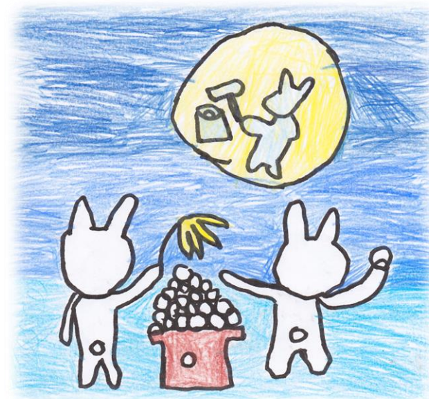
イラスト: 星野葉月(6歳) 編集: 星野幸恵

街の家族は、空家になっていた一軒家を利用したコミュニティーハウスです。赤ちゃんからお年寄りまで老若男女が集まって、大家族のような雰囲気の中、料理・ハンドメイド・陶芸教室・パソコン教室・ヨガ・英会話など色々なイベント、また普段からランチを一緒に作って食べたり、子供の見守り合いなどを通して、たいせつな地域のつながりを深めています。