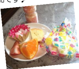
写真は子供用のデザートです。へ

もう一つオススメなのが特製デザート! これまでアップルパイ、プリン、レモンケーキを頂きましたがどれも絶品です♪