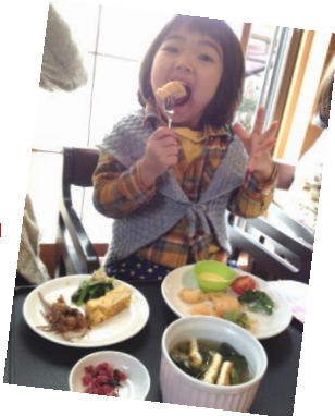
こちらにミニカレー&デザートが ついて 850 円!! イイお顔へ

特製のカレーが二種類（手羽先ミンチのモリカレーとポークカレー）日替わりでいただけます。四種類のカレーをブレンドし、じっくり炒めた玉ねぎで甘みを加えているそう。手羽先を煮込んだスープで作られたモリカレーはコラーゲンたっぷりでプルプルになるとか!? ポークカレーには隠し味でりんごのすりおろしが入りフルーティな仕上がりです。