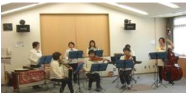
リズムックガーデン青葉台さんによる演奏♪

リズムックガーデン青葉台さんは、「子育てサークル」から音楽好きの仲間が集まって誕生したグループとのこと。子供たちを暖かく見守ってくださりながら、盛りだくさんの曲を演奏して頂きました。老若男女みんなで大満足のひと時を過ごしました。