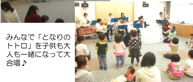
みんなで「となりのトトロ」を子供も大人も一緒に大合唱♪