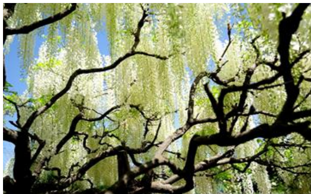
鶴川で通りがかりに見かけた白藤

街の家族は、赤ちゃんからお年寄りまで地域みんなが集まって『どんな時でもささえあえる』気軽な憩いの場所を目指しています。イベントへの参加のお申し込みは下記までどうぞ。